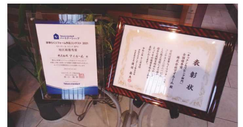
コンテストの表彰状

見た目最優先ではなく、実際に生活し始めてから気づく、やって良かったと思える感動が長く続く建物こそ、我々プロに求められる仕事だと考えています。