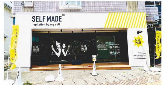
山大通りに開業したセルフ脱毛サロン「SELF MADE」

最近は脱毛サロンも増えてきていますが、「時間があるうちにやりたい。でも脱毛はお金が高い」と悩む学生が多いのではないかと考え、手頃な料金でできるセルフ脱毛の店舗を1階にオープンしました。予想と違い大学生より社会人の方によくご利用いただいています(笑)、評判は上々です。全体の5割近くは男性で、ひげ脱毛に利用されている方が多いようです。山大通りのほか、下関にも2店舗目をオープンしました。