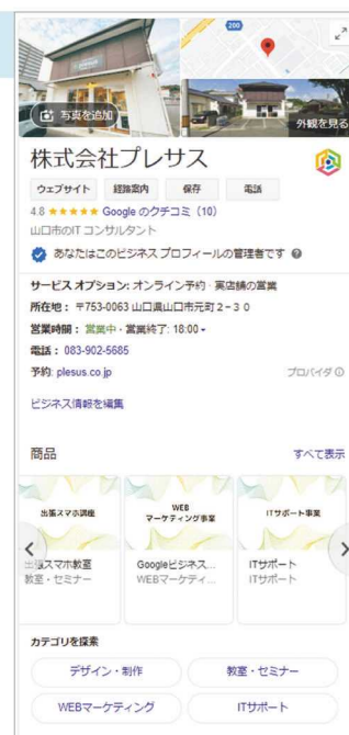
プレサスの Google ビジネスプロフィール

当社では、各社で推したいサービスなどについて丁寧なヒアリングを行い、効果的な写真の撮影方法や各社に合った内容で情報発信をすることで、集客に繋がられるようなサポートをします。また、適切な情報発信をすることで自社のイメージアップにも繋がり採用にも効果的です。Googleビ