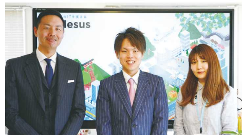
プレサスのメンバーの皆さん

お声がけいただければフットワーク軽く伺い、地域のIT化やDX化の困りごと解決に尽力していきたいと思っております。