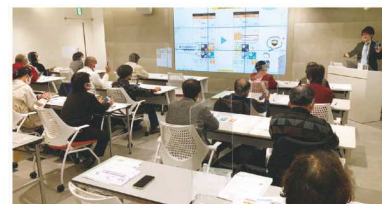
Y-BASE での高齢者向けスマホ教室

今年度から、高齢者の中からスマホの操作が得意な「スマホリーダー」を生み出す取り組みもおこなっています。研修会の受講者が各地区に戻り、近所の方々や所属するコミュニティの仲間へ内容を共有することで、誰1人取り残すことなく地域全体でのスキルアップに繋げていくことが目的です。今後も各地域でスマホの使い方を伝えられるような仕組みを普及できたらと思っています。山口ケーブルビジョン(12ch)で「人生100年時代 スマホで快適シニアライフ」という番組にも出演しています。ぜひご覧ください。