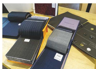
生地サンプルの一部

オーダーメイドスーツにも様々あるのですが、ラディアントではイージーオーダーを採用しています。見た目のカッコ良さを崩さずに、その人にあった体系の補正を適切に入れることで、着心地も抜群のスーツを仕上げるのが可能です。