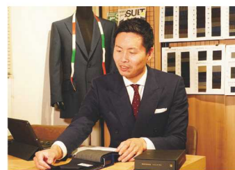
店内でのヒアリングの様子

集客に関してはプレサスで培ってきたノウハウを反映しており、ウェブ経由での問い合わせがほぼ100%と言えます。出張で山口に来られていた方がネットで検索して来店されたこともありました。とはいえ、まだ十分に「マイスター」の認定証認知されているとは言えません。山口にも本格的なオーダースーツができる場所がある、ということをより広めていきたいです。