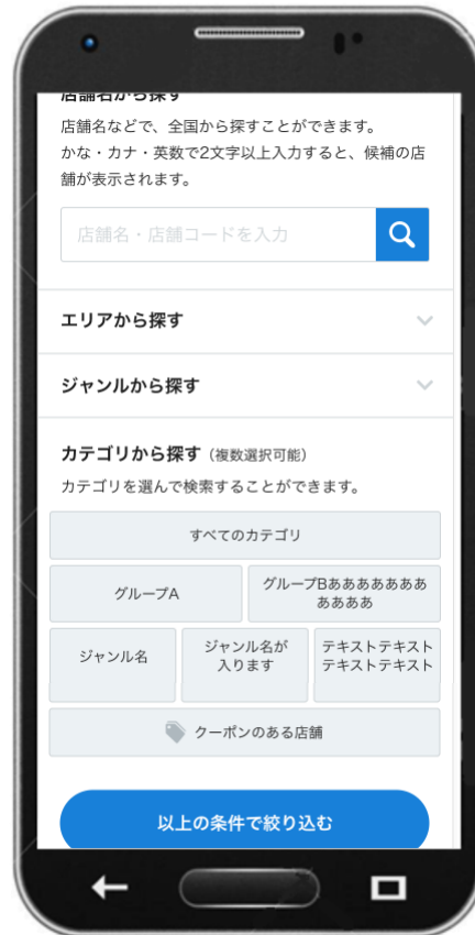
②店舗名、エリア、ジャンルから検索