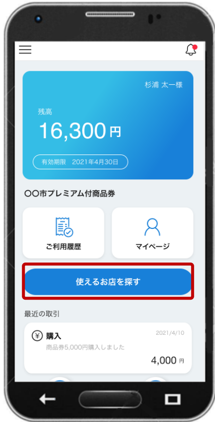
①「使えるお店を探す」を選択