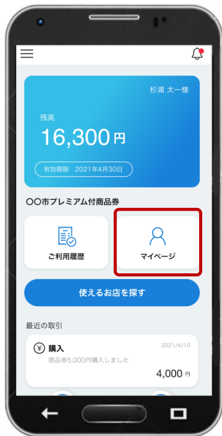
①「マイページ」を選択