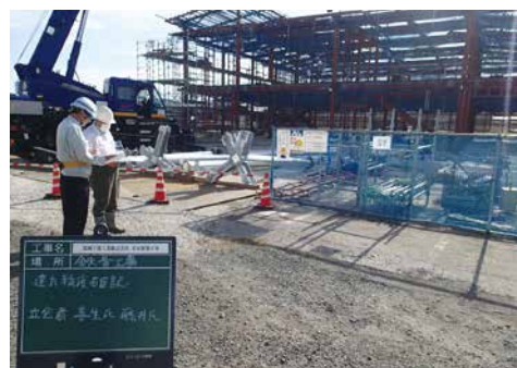
新社屋の鉄骨工事中の様子

また、当社では「全員が営業」と伝えています。営業職の社員もいますが、技術者（現場監督）も営業としての心構えを持つように、ということです。現場に入っている間に「こういう仕事は頼めますか」というような話 わ が来 き ることもあります。そういったところから新しい仕事に繋がることもあるので、すぐに判断がつかなかったとしても、先輩や私に相談するよう話しています。