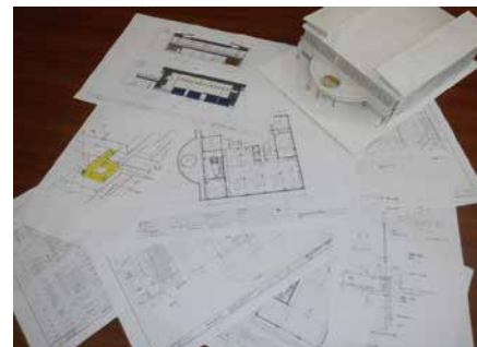
新社屋の設計資料

新社屋については以前の社屋が約50年前に建てられたもので、耐震性がなく、隙間風や雨漏りがあるなど居住性にも問題があり、コンセント口も少なく様々な機器を使うようになった今の時代に合わないことなどから、建て替えを決めました。設計に1年かけ、新型コロナウイルスの影響から資材が入らない時期や価格高騰もあって建設にも1年と、時間も予算も当初の想定より多くかかってしまいましたが、令和4年に完成しました。