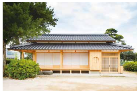
幕末志士にゆかりのある何遠亭を模して新築した建物

鴻城土建の昔からの一貫した考えで、スローガンにもあるように、私たちが売りにしているのは技術力です。先人からの技術継承、そしてそれ以上の技術向上を目指しています。相応の価値を感じていただける技術力と、真摯に各現場に向き合う真心が、当社の付加価値になるものだと考えています。